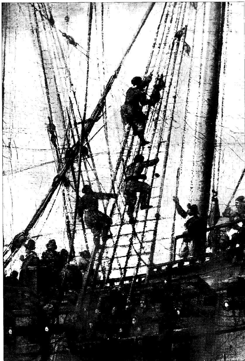
Zeelieden klimmen in het wand van de 'Peter en Paul'. Een stuurman schreeuwt ze van het dek nog instructies toe. Detail van een schilderij door A. Storck 1698. (Foto J.W. Moerman).